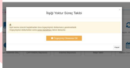
Şekil 2 İlişigi Yoktur Süreç Takibi